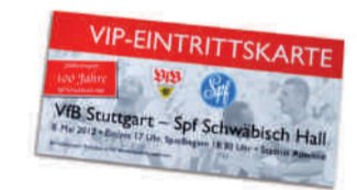
Für personalisierte Unterlagen ist der Digitaldruck prädestiniert.